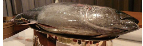
※マグロはお刺身で提供します

♡ 8/13,14,15 ファミリーバイキング開催 詳しくは↓下の記事をご覧ください ③通常ピアホールはお休みします