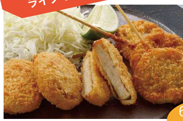
マグロカツと野菜の串揚げ