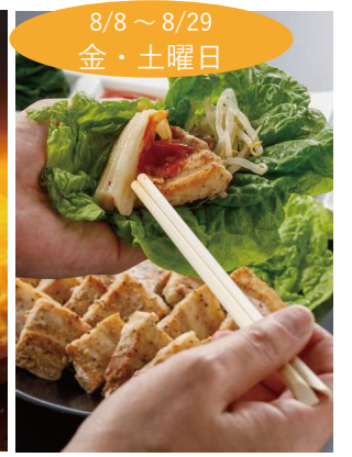
8/8 ~ 8/29 金・土曜日