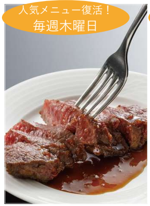
人気メニュー復活！ 毎週木曜日