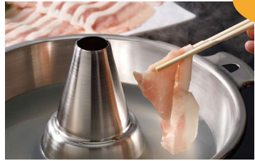
豚肉のしゃぶしゃぶ